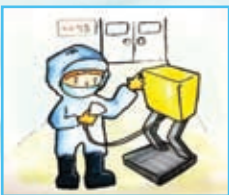
식품회사 작업장 출입구