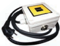
⑥ on/off Control box