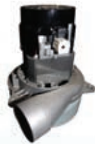
⑦ Motor 220V