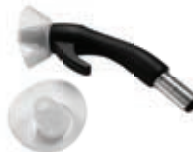
⑨ Gun assembly chip guard