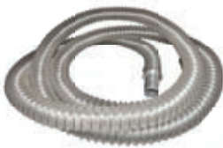
① Portable hose